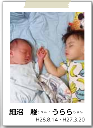
細沼 駿ちゃん・うららちゃん H28.8.14・H27.3.20