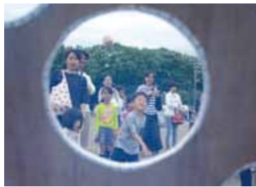
↑各地区では輪投げやボール投げの催しのほか、けん玉などの昔遊びも実施。

5月14日(日)、役場前グラウンドで行われた第38回子どもフェスティバル。趣向を凝らした各地区の出し物や子どものお囃子、児童館で猛練習を重ねた一輪車の披露などで盛り上がりを見せました。この日は子どもたちが主役。イベントを存分に楽しむ様子が各所で見られ、会場は未来にはばたく子どもたちの笑顔に包まれました。