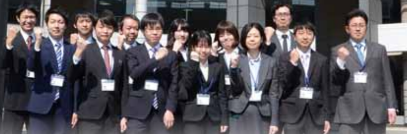
問 総務課職員担当 内 407・408 ★受験資格等の詳細は総務課職員担当までお問い合わせください。