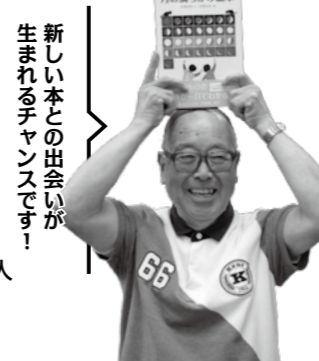
新しい本との出会いが生まれるチャンスです!

▶内容 紫外線に関する実験とUVチェックストラップ作り。 ▶参加費 1人100円(材料費) ※申込時に徴収。 ▶申込方法…中央図書館で7月15日(土)10:00から受付。電話不可。