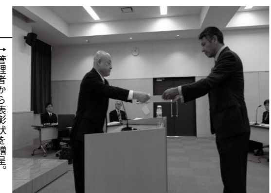
→管理者から表彰状を贈呈。

5月16日・17日の2日間、東消防署と西消防署で開催された園児消防見学会。防火教育の一環として毎年度実施し、今回は約2,000人の園児が参加し、防火演劇や救出訓練を見学しました。