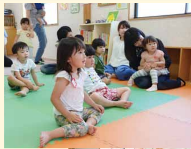
絵本の読み聞かせでは、先生のお話に合わせて笑い声やびっくりにした表情など、楽しく過ごしました。