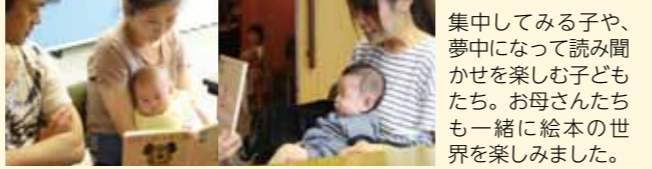
集中してみる子や、夢中になって読み聞かせを楽しむ子どもたち。お母さんたちも一緒に絵本の世界を楽しみました。