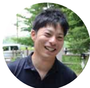
青少年相談員会長