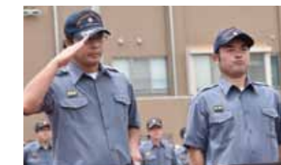
↑表彰を受ける優勝した第三分団の皆さん。

7月2日(日)、日頃の鍛錬の成果を競う消防操法大会が開かれました。ポンプ車を起点にホースを伸ばし、火点に向かって全力疾走。安全確認と動きの連携も決して怠りません。優勝した第3分団を筆頭に、3位までを三芳町の消防団が独占。自らの手で地域を守るという意志の強さが感じられました。