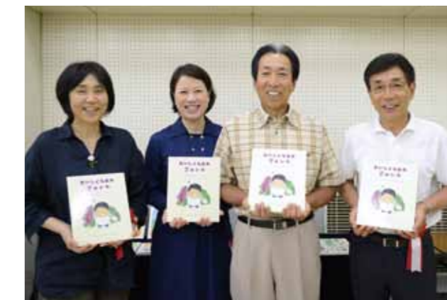
↓絵本作りに携わった皆さん。想いの詰まった素敵な絵本が完成しました。

7月7日(金)、三芳町役場で認定農業者の認定式が行われました。認定農業者制度とは、農業経営基盤強化促進法に基づき、農業者自らが5年後の農業経営改善の目標と達成のための取組内容記載した農業経営改善計画を作成し、市町村が作成する基本構想に照らして、認定する制度です。本年は新規で5人が認定農業者に認定されました。