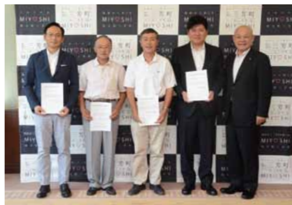
↓認定農業者に認定された皆さんと林町長。