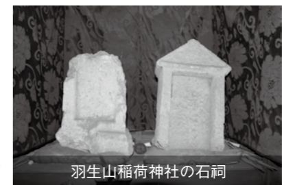
羽生山稲荷神社の石祠

北永井とふじみ野市亀久保との境の県立ふじみ野高校付近は羽生山と呼ばれる、山林の中には羽生山稲荷神社が祀られている。農村地帯の稲荷は一般的に五穀豊穣にご利益があるという性格が強いが、羽生山稲荷は、むしろ商売繁盛や失せ物探しにご利益があるとされ、願いがかなった際には奉納旗や朱の鳥居を奉納するものだとされる。そのため現在の羽生山稲荷神社参道入口から社までは、朱色の奉納鳥居が立ち並び、京都伏見稲荷の有名な千本鳥居を思わせる景観になっている。羽生山稲荷が祀られた起源は不明だが、昔、羽生山にヤマ掃き(落ち葉掃き)に来た人が子を宿した狐を殺してしまい、祟りがあったため稲荷として祀ったと伝えられる。