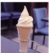
コーンの中までアイスがぎっしり詰まっています

今回のプレゼントはコピスみよし1階にある福祉喫茶ハーモニーさん。障がいのある人が生き活きと働く喫茶店です。