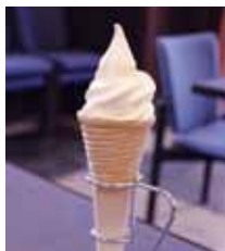
コーンの中までアイスがぎゅっり詰まっています

今回のプレゼントはコピスみよし1階にある福祉喫茶ハーモニーさん。障がいのある人が生き活きと働く喫茶店です。