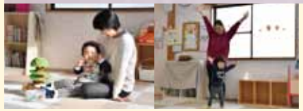
「さんぽ」の音楽に合わせて、寒さを吹き飛ばすくらいの元気なダンス! ママと一緒に楽しみました。

北永井児童館 ☎258-9962 ●藤久保児童館 ☎258-9965 ●竹間沢児童館 ☎259-8315