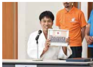
↑貴重な写真を手に語る高橋選手。後半では柔道の技を披露し会場を沸かせました。

8月4日(日)、総合体育館研修室で障がい者スポーツ体験会が開催されました。最初に行われたのは、ロンドン2012パラリンピック男子柔道73kg級5位入賞の高橋秀克選手の講演会。選手視点の貴重な体験談に参加者は聞き入っていました。続いて行われた体験会ではポッチャと卓球バレーが実施され、白熱した試合に大きな歓声が上がっていました。