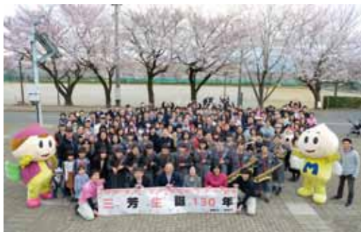
←今年4月1日に実施した三芳生誕130年記念式典の様子。

三芳生誕 130 年を記念し、幕末から明治にかけての三芳地域に関する資料をパネルにて巡回展示します。