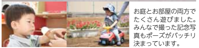
お庭とお部屋の両方でたくさん遊びました。みんなで撮った記念写真もポーズがバッチリ決まっています。