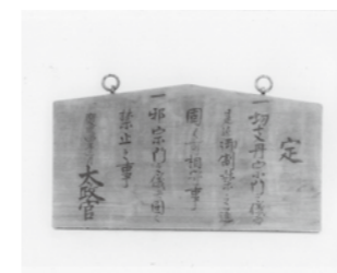
↑「慶応 4 年太政官高札」

慶応 4 年 (一八六八) 1 月に始まった戊辰戦争は翌年 5 月に終結し、新政府は全国の支配体制を確立するに至った。この間にも新政府は政治組織を定め、地方統治の整備に着手し、中央集権化を着々と進めていたのである。 新政府の基本方針は、慶応 4 年 3 月に天皇が京都で発表した「五箇条の誓文」で示された。開明的な内容が盛り込まれ、新政府は五箇条の誓文の趣旨に基づき、最高行政機関として「太政官」を置いて欧米諸国を模倣した三権分立・官吏公選と、地方の統治には府藩県三治制を規定した「政体書」を発表した。 慶応 4 年 3 月付で上富村に掲げられた、2 枚の高札が残っている。新政府は、五箇条の誓文を発表した翌日、旧幕府の高札を撤去し、そのあとに五枚の高札 (五榜の掲示) を掲げた。その内容は、旧幕府の高札と似た「悪行の禁止」「徒党強訴逃散の禁止」「切支丹や邪宗門の厳禁」と、独自の「万国公法の履行」「脱籍の禁止」であったが、最後に大きく「太政官」と書かれていた。こんなところでも、村々では時代の移り変わりを感じたのだろうか。 また、新政府は全国を府県藩の三つに分けて統治を開始した。没収した旧幕府領・旗本領のうち、東京・大阪など重要な地域を「府」として知府事を置き、そのほかの地域は「県」に分け知県事を置き、諸藩領については知藩事の支配とした。これにより、竹間沢・藤久保両村は従来通り川越藩に属している。一方、武蔵国の旧幕府領下では、慶応 4 年 6 月に岩鼻県が設置され、次いで 3 人の武蔵知県事が任命された。北永井・上富両村は、代官であった村松武蔵県知県事の支配を受けた。その後新政府は、中央集権体制を確立するため、残存する封建機構を一掃し、入り組んだ地域の確定を断行していくのである。