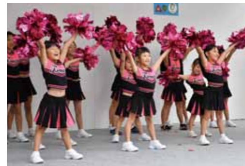
←昨年のステージの様子。笑顔溢れる素敵なパフォーマンスが産業祭を盛り上げてくれました。

三芳町の美味しい野菜や商工業品が集まる産業祭を盛り上げてくれるパフォーマーを大募集！来年は町制 50 周年の節目の年を迎え、「町制 50 周年カウントダウン」として自由な発想でのパフォーマンスを募集します。