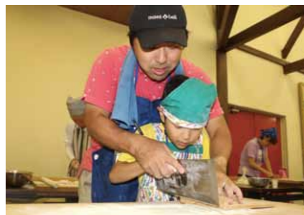
↓伸して重ねたそばを同じ幅になるように丁寧に切っていきます。