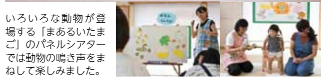
いろいろな動物が登場する「まあるいたまご」のパネルシアターでは動物の鳴き声をまねして楽しみました。