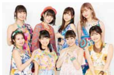
8人組グループ Juice=Juice。最新シングル「ひとりで生きられそう」ってそれってねえ、褒めているの？ /25 歳永遠説はオリコン週間 3 位。

大使を務める三芳町での初め のイベント。10月22日(祝・火) のコピスみよしで、トップアイ ドルの歌声とイベントを楽しん でみませんか。■