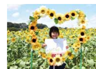
↑ひまわりのフォトスポットで、思い出のスケッチと一緒に記念撮影。

7月27日(土)・28日(日)、早川農園で三富落ち葉野菜研究グループ主催のえだまめがりが行われました。落ち葉堆肥農法で育ったえだまめを求める人々で畑は満員になりました。会場には、ひまわりのフォトスポットや輪投げなどのブースも登場。両手いっぱい抱えるほどのえだまめを持ち帰る参加者の表情は笑顔に満ちあふれていました。