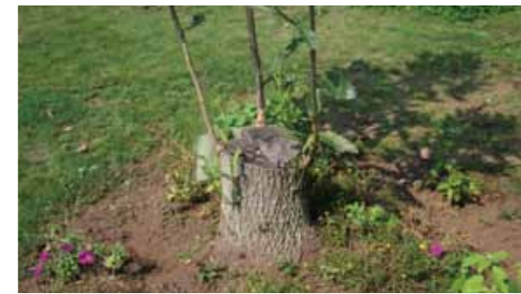
←伐採した切り株から伸びた芽が成長して新たな樹木になります。

樹木を伐採した後、切り株から新しい芽が出て、数年後には元通りの大きさに成長する樹木の生態を「萌芽更新」と言います。町では「彩の国みどりの基金」を活用し、萌芽更新のための雑木林の伐採費用を補助します。