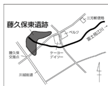
↑藤久保遺跡の広がり

調査では、地下3mほどの深さから、旧石器時代の川跡も発見されました。現在の藤久保第1公園があるところからです。今は憩いの場として親しまれているこの場所も、太古の昔には人々が狩りをして暮らす光景が広がっていました。