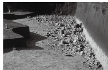
↑川原石が広がる当時の川跡(一部)