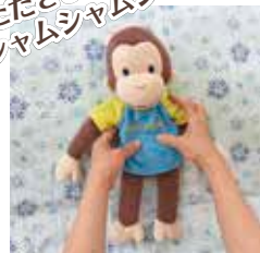
⑦歌に合わせて手をたたいた後、くすぐる。