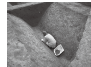
↑V字型に深く掘られていた溝

本村南遺跡で平成19年に行われた発掘調査では、今から約2000年前、弥生時代の住まいの跡や溝の跡が見つかりました。 なかでも溝は、幅約3m、深さ約1.5mと大きなものでした。溝の中に積もった土を観察したところ、水が流れていた痕跡は見られなかったことから、この溝は用水路などではな