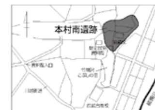
↑本村南遺跡の広がり

暮らしやすい土地 く、外敵や獣の侵入を防ぐ目的で、ムラを囲むように掘られたものだと考えられます。また、溝の中からは、大量の土器や川原石が見つかりました。溝が使われなくなった後に投げ入れられたものと思われる。