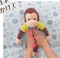
⑤両手で塗るようにお腹をなでる。