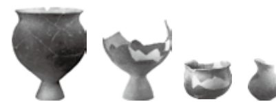
↑溝から出土した大量の土器片を接合して復元したもの(一部)

本村南遺跡では、ほかに弥生時代の住まいやお墓の跡がいくつも見つかっています。 眼下に川が流れ、見晴らしも良いこの地区は、太古の時代から住みやすい場所として、長くムラが続いてきました。その暮らしは、現代まで連続と続いているのです。