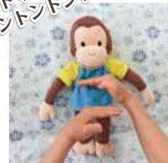
③手でトマトの形を作った後、体をトントンする。