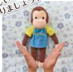
①歌に合わせて手をたたく。