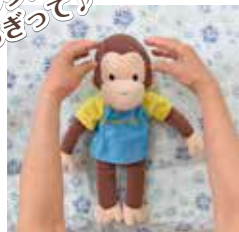
④頭をなでて、ちぎるような動作で髪をさわる。