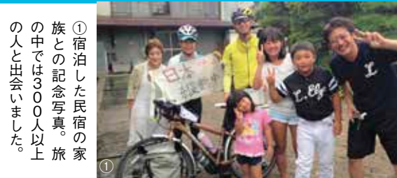
① 宿泊した民宿の家族との記念写真。旅の中では300人以上の人と出会いました。