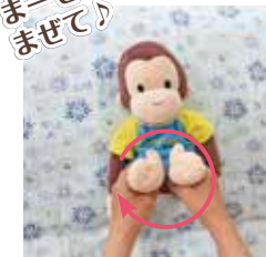
⑥両足を持ってグルグル回す。