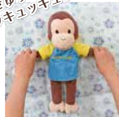
②腕をさすって揉む。