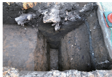
↑ケヤキの根の真下にある溝

平成22年の調査で発見された、上富地区の溝。果たしてこの溝は1694年に始まった三富開拓の際に掘ったとされる水路の跡なのか？その疑問を解き明かすため、様々な角度から分析を行いました。 溝の底に溜まっていた土を分析することで、かつて溝がどのような状態だったのかを推定できます。結果、溝の土からはきれいな水が流れる場所に生息する植物プランクトンの化石が検出され、この溝には当初、きれいな水が流れていたことが分かりました。 左の写真にもあるように、溝は現在溝の底に溜まっていた土を分析すること、かつて溝がどのような状態だったのかを推定できます。結果、溝の土からはきれいな水が流れる場所に生息する植物プランクトンの化石が検出され、この溝には当初、きれいな水が流れていたことが分かりました。 また、1863年に描かれた上富村地割絵図には、調査で溝が発見された場所と同じところに、かつて水路があったと書かれています。こうした事実や分析結果を考えると、この溝は江戸時代の三富開拓の際に掘られたとされる水路の跡である可能性がある、と考えられるのです。