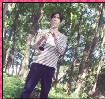
Instagram @hitsujun 藤久保の平地林で演奏!