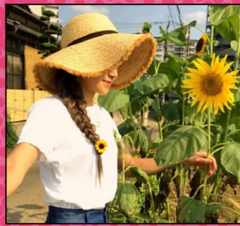
Instagram @nabesaaaaan95 育てたひまわりと撮影!

SNS で三芳町の魅力を発信している「三芳アンバサダー」のみなさんのすてきな投稿を紹介します。