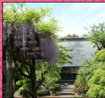
多福寺の美しい庭園!