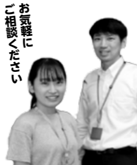
お気軽にご相談ください