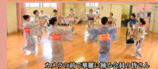
カメラの前で華麗に踊る会員の皆さん