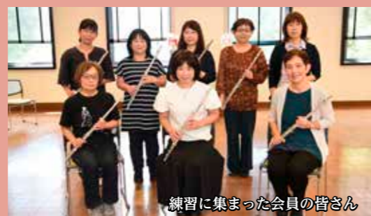
練習に集まった会員の皆さん

昨今、披露する場が減ってしまいましたが、また多くの人に演奏を聴いていただける機会を楽しみに活動していきます。