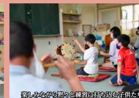
楽しみながら黙々と練習に打ち込む子供たち