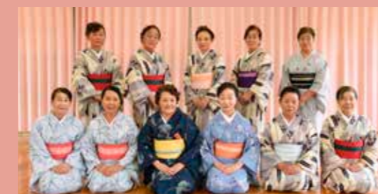
来年6/18(日)には「40周年のおさらい会」を開催します。

小さなお子様からお年寄りまで、楽しくお稽古して多くの方々に踊っていただきたいので興味がある方は気軽にお声がけください。