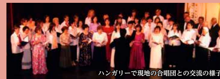
ハンガリーで現地の合唱団との交流の様子

現在は、新型コロナウイルスの影響で本来の活動である合唱ができず、今まで練習してきた曲のCDで各自自宅練習するという状況です。苦しい想いをしていますがまた合唱できることを目標に頑張っていきたいと思います。