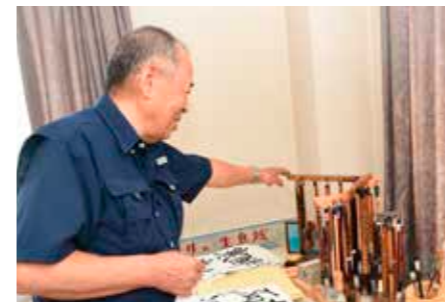
▲自身の会社事務所にはいつでも書ができるアトリエを備え付け。様々な書風を書けるように筆を50本以上も揃えています。

生まれも育ちも三芳町。20代に職場で当時手書きだった書類綴りの表紙を書くため書道を始める。現在は最高段位の師範で雅号は澄山(ちょうざん)。