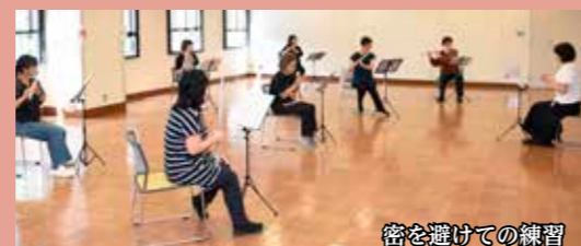
密を避けての練習