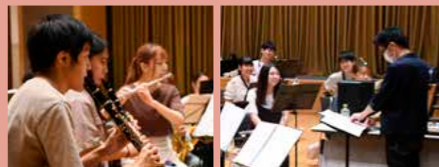
▲真剣ながらも音楽を楽しめる環境に笑顔がこぼれます。

現在はコロナの影響でお客さんを入れての演奏は中止してしまいましたが、継続してやってきた活動を止めたくないという思いで、配信などに切り替えて活動を続けています。年内では12/24(金)20:00からYouTubeで生演奏を配信でお届けするので是非ご覧ください。