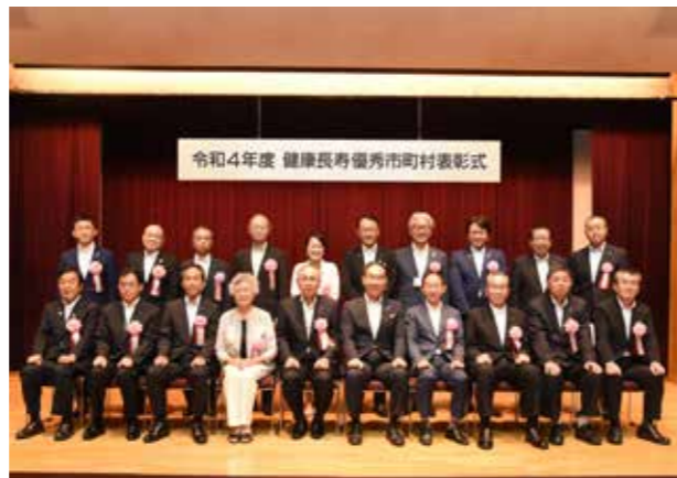
↓表彰された県内19市町の首長らと大野知事。

一般社団法人自治総合センターでは、宝くじの社会貢献広報事業として、宝くじの受託事業収入を財源に、コミュニティ助成事業を実施しています。今年度は藤久保第4区が助成金を受け、集会用テント、LEDスタンドライト、発電機、かまどセット、物置等を購入しました。イベント等で活用され、地域コミュニティの発展と相互扶助機能の向上を図っていきます。