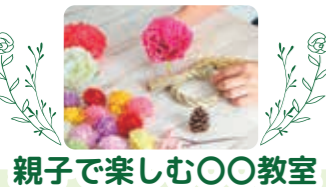
親子で楽しむ〇〇教室

住民・事業者の皆さまからのイベント情報・ おすすめ情報・求人情報の投稿をお待ちしております!