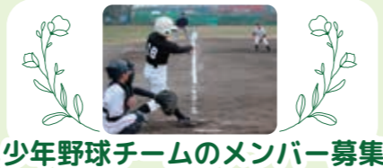
少年野球チームのメンバー募集