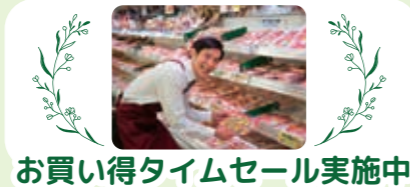
お買い得タイムセール実施中