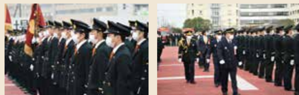
▲▶ 団員の規律や姿勢、服装などを点検する特別点検