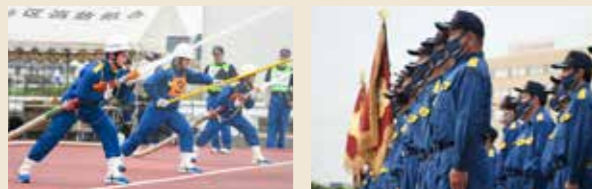
▲▶ 日ごろの鍛錬の成果を競う操法大会の様子

消火活動・災害時の救助救出活動・避難誘導・災害防衛活動・防火指導・巡回広報・特別警戒・応急手当指導など