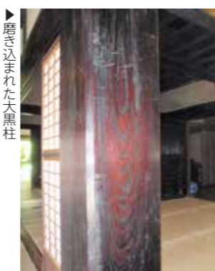
▶磨き込まれた大黒柱

大黒柱とは、家族やチームなど集団の中心人物という意味もあります。が、本来は、建築物の構造上最も重要な柱を指します。この大黒柱を中心に梁や桁が「ほぞ」によって組み込まれ、他の柱へつながっていきます。家の中で最も加重や負荷がかかるため、旧池上家住宅では他の柱に比べて特に太く、約33センチメートルの角の堅く美しい木目を持つケヤキ材が用いられています。まさに一家の大黒柱というにふさわしい風格があります。大黒柱から延び