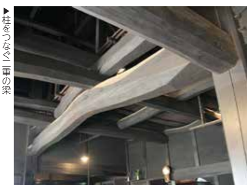
▶柱をつなぐ二重の梁

る牛梁を土間の中央で支える柱が小黒柱と呼ばれます。土間に入って正面を見上げると大黒柱と小黒柱を繋ぐ、上下二本の太く曲がりくねった松材の牛梁が目にとまります。よく見ると牛梁に直交するように組まれた別の二重梁が交互に組まれています。これは見栄えを良くするだけではなく、屋根の荷重や地震などによる揺れの力を分散させる役割も担っています。