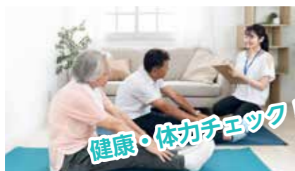
健康・体力チェック！