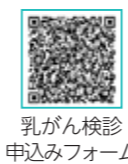
乳がん検診 申し込みフォーム

無料クーポン対象者は二市一町実施医療機関での個別検診も選択できます。マンモグラフィ検査を行います。注意事項をよく確認のうえ、お申し込みください。