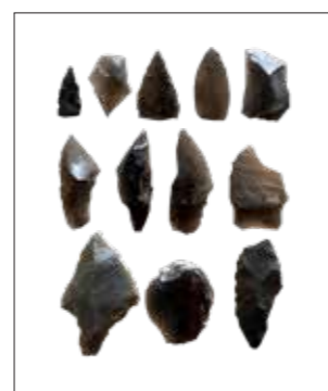
▲新開遺跡出土 石器

新開遺跡は、現在、マンションや工場、倉庫などが立ち並ぶみよし台から竹間沢字新開まで広がる遺跡です。土地区画整理事業に伴って、昭和51年度から大規模な発掘調査が行われました。この発掘調査は、三芳町で初めて行われた本格的な発掘調査であり、今までわからなかった三芳町の原始・古代について知ることができた初めての一步でした。それ以降、これまでに20カ所以上の地点で調査が行われ、旧石器時代(約2万年前)のキャンプ跡や平安時代(約1千年前)の須恵器と呼ばれる器を生産した跡が発見されています。