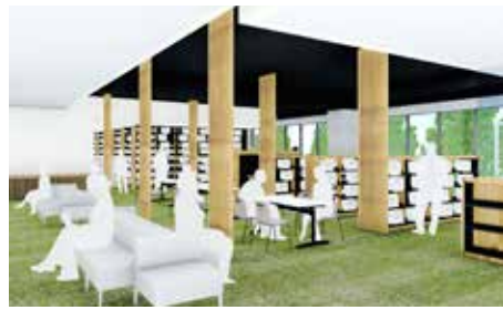
20 図書館開架 書架(2階)

町の特徴である雑木林の中での読書をコンセプトにした図書館。下草をイメージした緑色の絨毯と木製ルーバーにより、木のぬくもりを感じながらゆったりと本と触れ合えます。