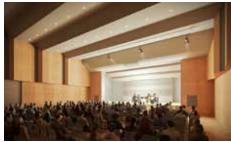
1 多目的ホール (1階)

小学校と複合公共施設に囲まれた広場スペースは、施設の活動がにじみ出てくるようなイベント広場。大階段やテラスも活かした多彩なイベントが可能。