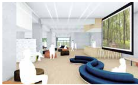
11 コミュニティ スペース(1階)

芸術文化のまちづくりを進める三芳町の新たな発信拠点として、ミニコンサートや発表会など、幅広く使えるホール。音響効果を考慮した作りで約200人を収容予定。