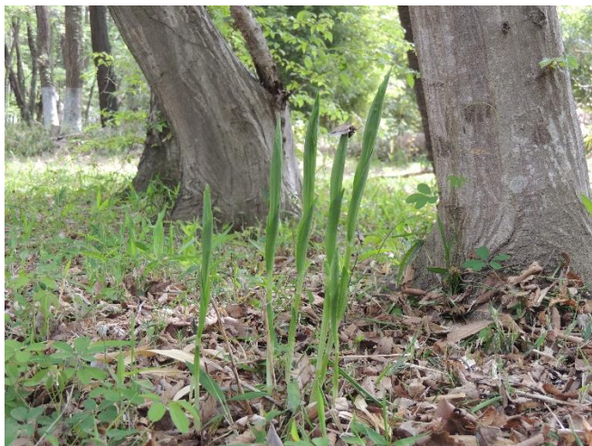
キンランの芽生え