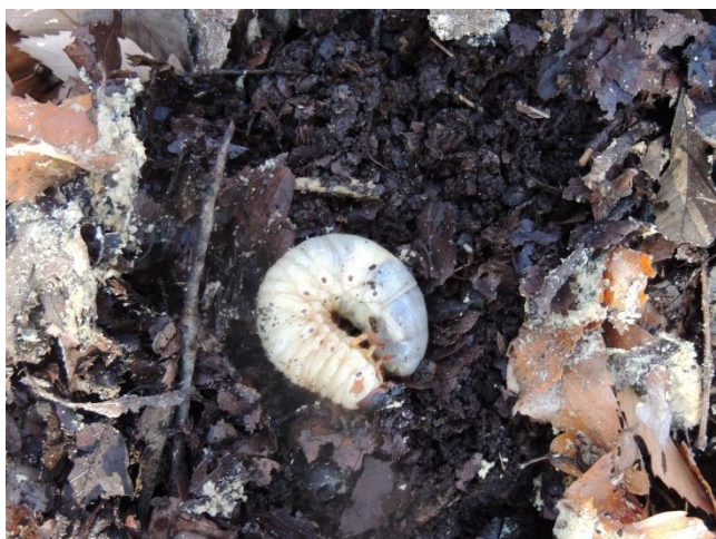
堆肥置き場にはカブトムシのさなぎが沢山います