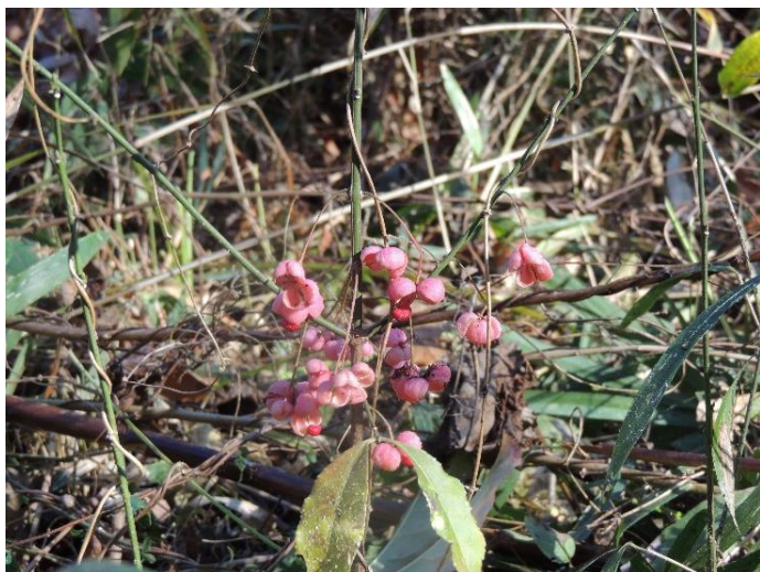
マユミの実でしょうか