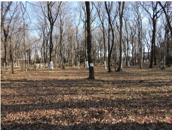
きれいに整備された林床

落ち葉掃き直前の刈込隊活動は、林床はいつでも落ち葉掃きができる状態になっていることから、今回は落ち葉掃きの邪魔になる林内に落下している枝拾いを実施しました。