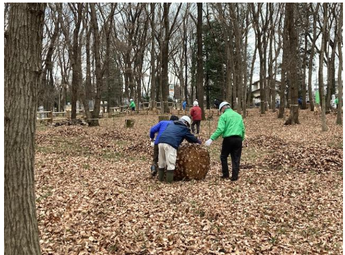
江戸時代から変わらない竹籠を今回使用 しっかり踏み固めると60キロは入る