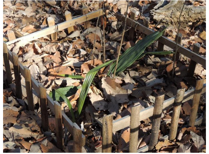
サイハイランのは葉