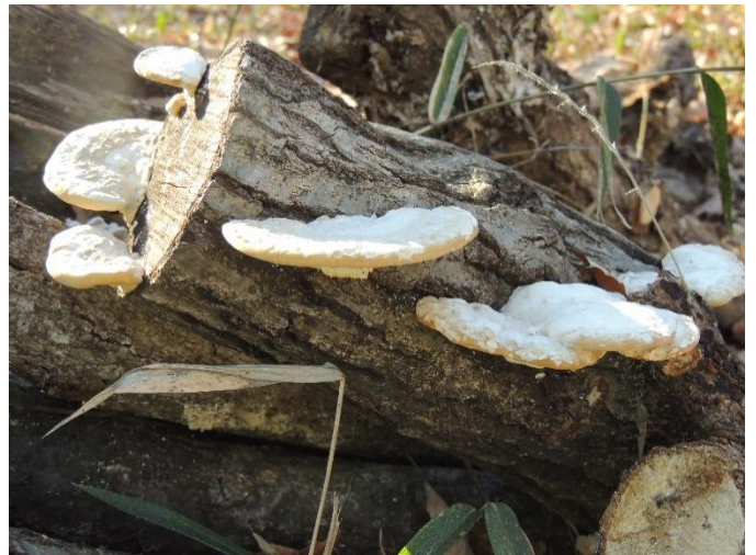
伐採した幹に生えているキノコ