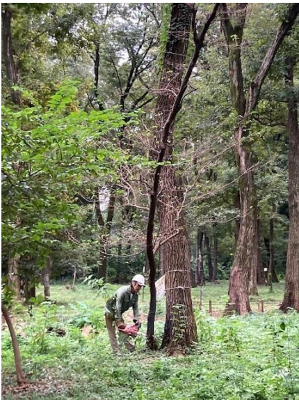
枯れた枝を切り倒しています。