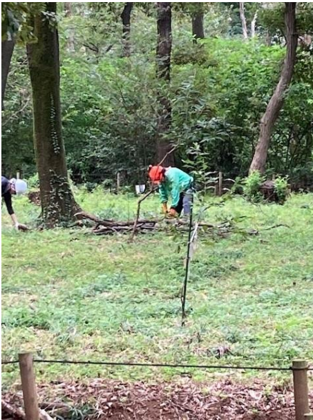
長い枝をチェーンソーで切断

昨夜、雨が降ったので林内は湿気がありましたので、草の収集は重くなって大変なので、本日の作業は、林内に落下している枝の収集・搬出を実施しました。ようやく気温が下がって秋らしくなってきましたので、9月初旬からすれば、本当に楽になりました。しばらく枝の収集をしていなかったため長い枝が多くあります。長いものは搬出できる長さに鋸で切断、太い枝は処理場には持ち込めないため、適当な長さにチェーンソーで切断し、林内に積み置きします。落下した枝は伸びた草の中に埋もれているので探しながら収集します。特にD地区は落ち葉掃き会場となりますので、丁寧に取り除きます。対象地区の面積が広いことから、皆さん作業しながら相当な距離を歩いたと思います。