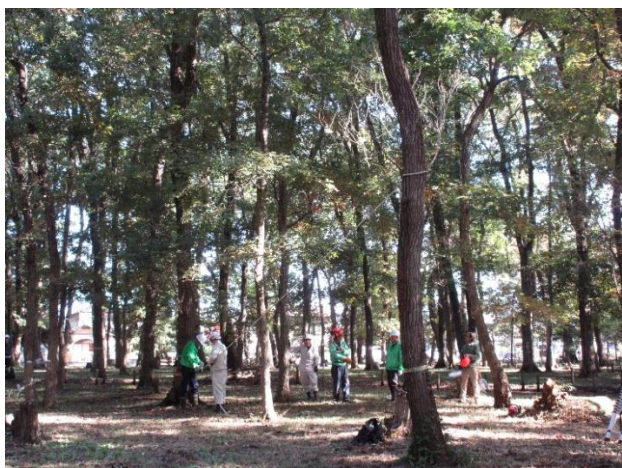
林内に枯れた木があったので伐採することになりました。倒す方向を確認しています。方向が決まると伐採開始です