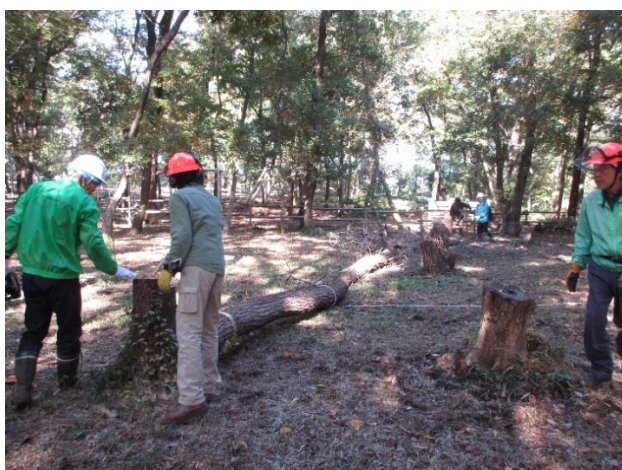
伐採した樹木です。切り株はきれいに措置をしました。