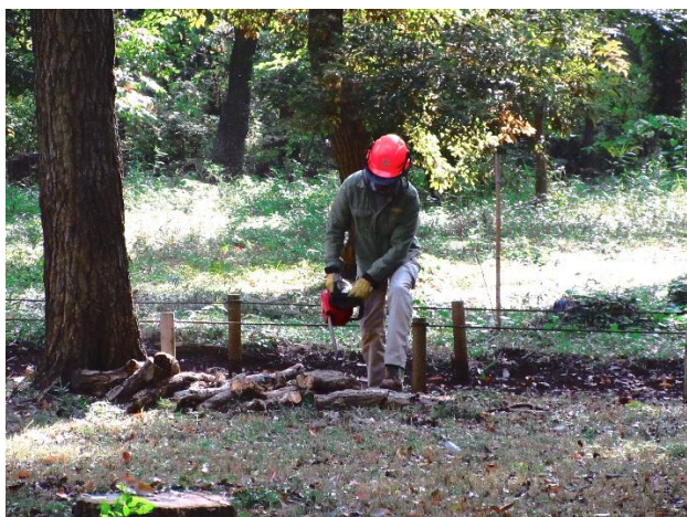
長い枝をチェーンソーで切断