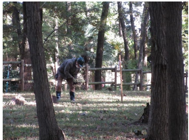
集めた枝を束ねています