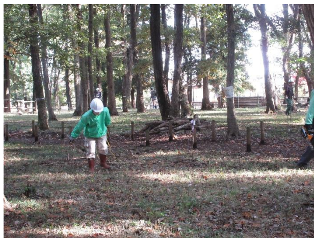
落下している枝を探しています