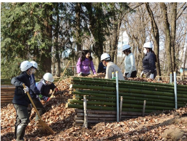
積み上げた落葉を踏み固めます