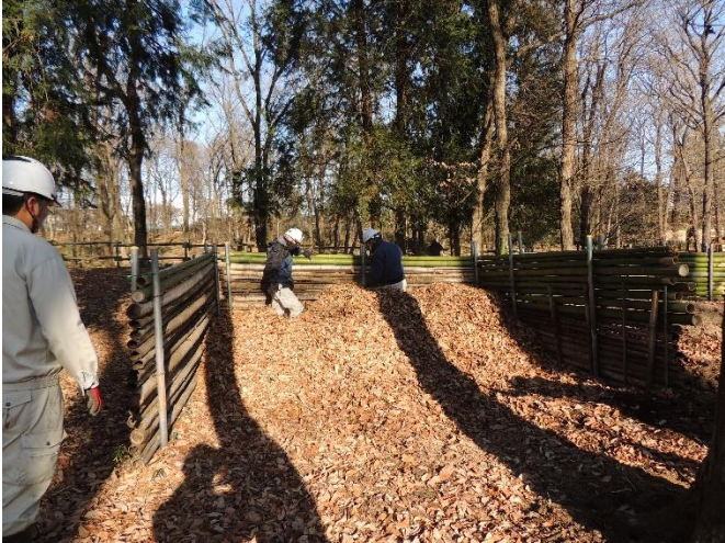
堆肥場に積み上げます