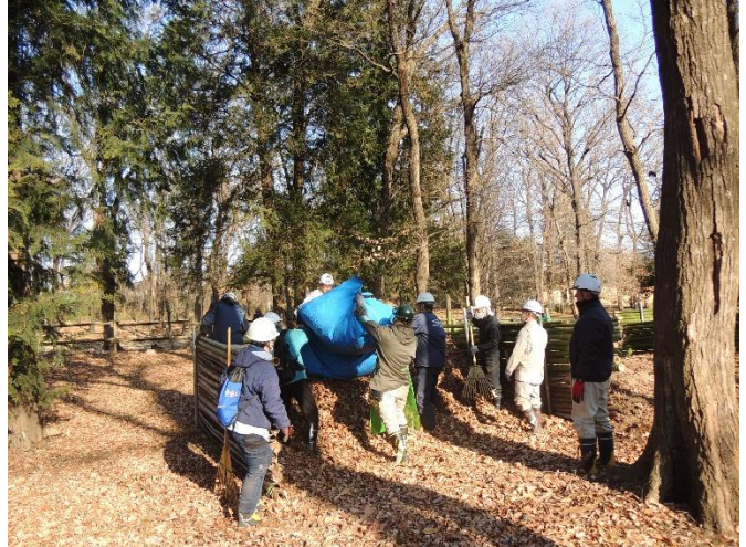
シートから返して積みます