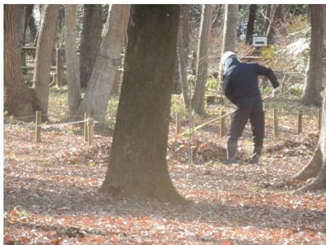
落ち葉の山が連なりました