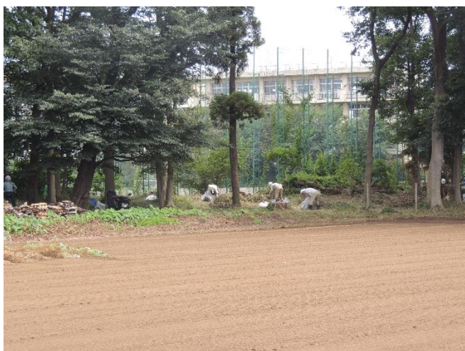
手前は畑 向こうに見えるのが中学校