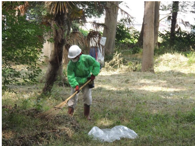
熊手で刈り取った草を集めます