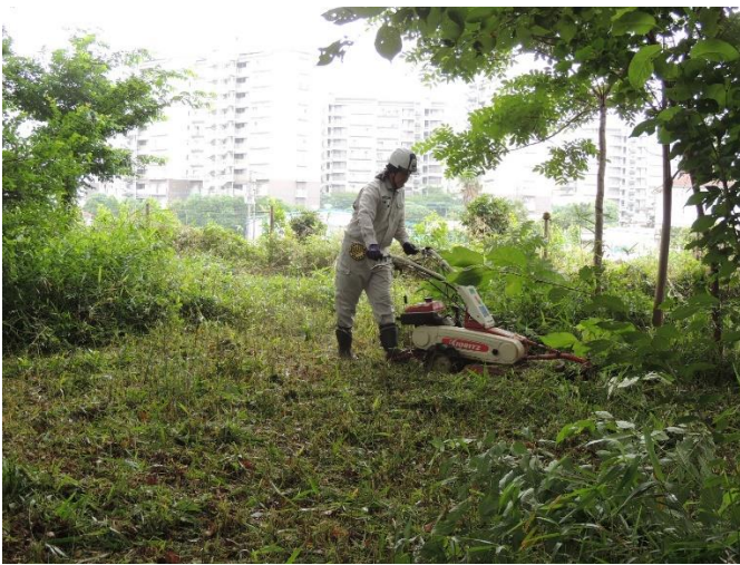
自走式草刈機による刈込