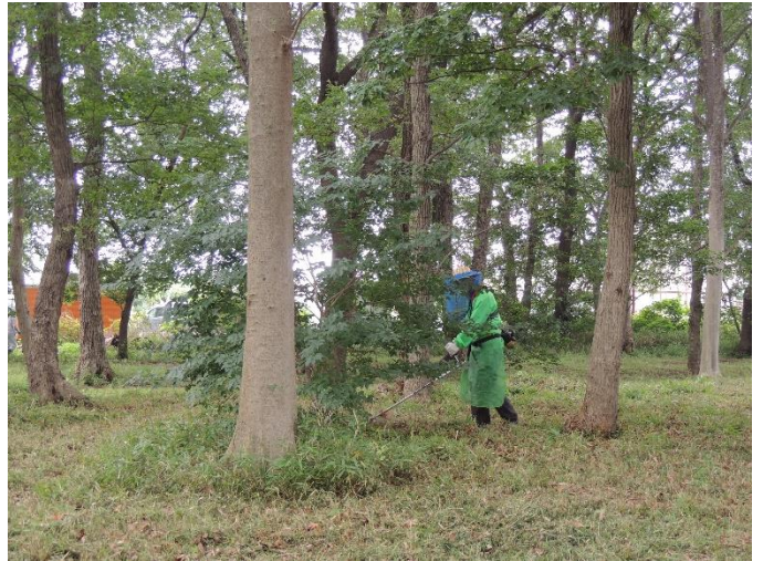
刈払機での作業(重装備)