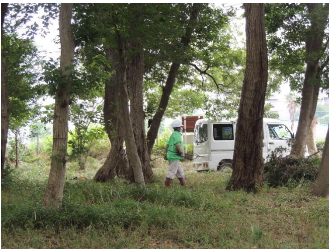
刈込に支障きたす枝を除去しています