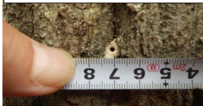
コナラへの穿孔状況