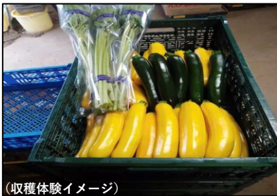
(収穫体験イメージ)