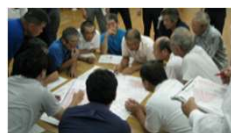
将来の目標地図例