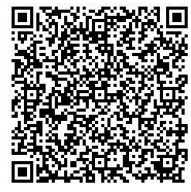
電子申請サービス QR コード

申込み: 観光産業課へ電子申請サービス・電話・窓口のいずれかで申込み 三芳町 観光産業課 TEL:049-258-0019 内線 212 (平日の8時30分～17時)