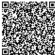
電子申請サービス QRコード