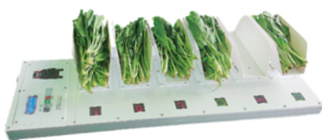
(株)オーケープランニング