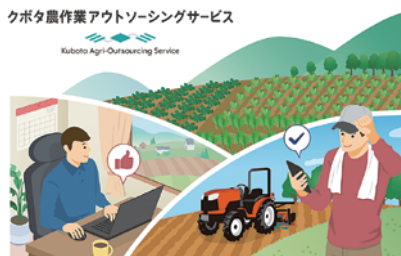
クボタ農作業アウトソーシングサービス