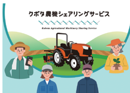
クボタ農機シェアリングサービス

Kubota Agricultural Machinery Sharing Service