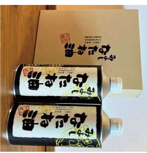
③三芳産 なたね油 2本セット