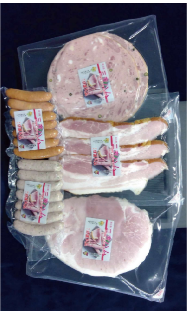
④日進ハム 5点セット