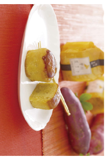
⑨早川ポテト 富の川越いもを使用したスノーポテト