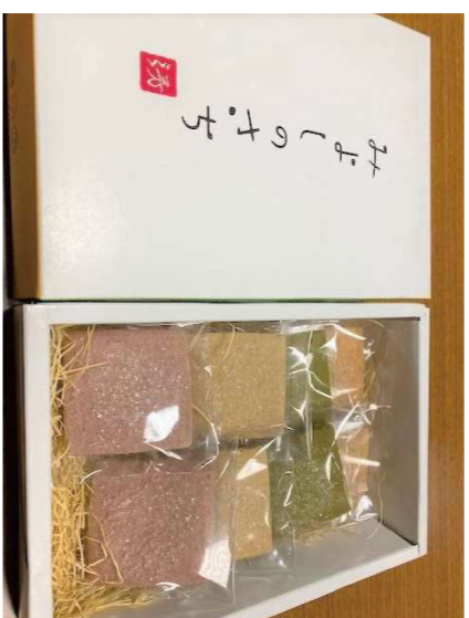
⑤みよしのさち クッキー 2箱セット