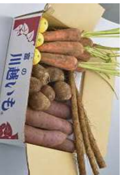
⑧三富落ち葉野菜セット