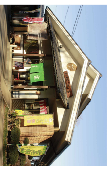
⑥手打そばうどん富 (住所：三芳町上富 155) 3,000円分お食事券 ※有効期限：令和7年2月末日まで