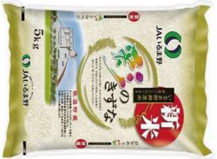
①埼玉県産 彩のきずな 令和6年産新米 5kg