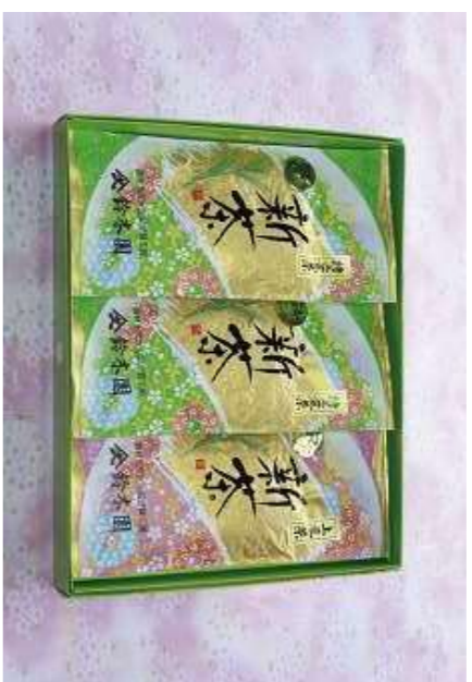
②三芳産 狭山茶セット