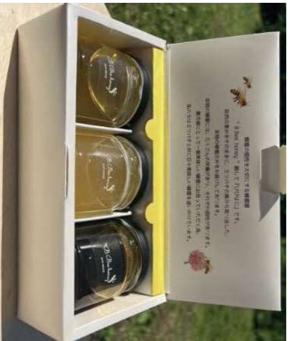
⑩三芳町で採れた はちみつ3点セット