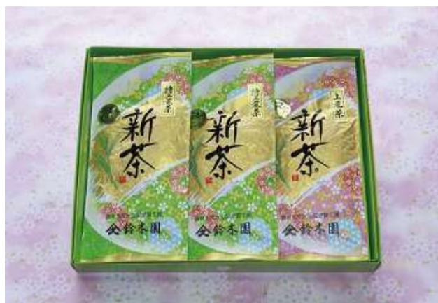
②三芳産 狭山茶セット