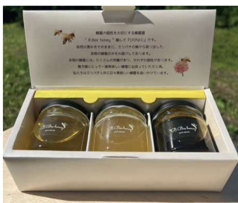
⑩三芳町で採れた はちみつ 3点セット