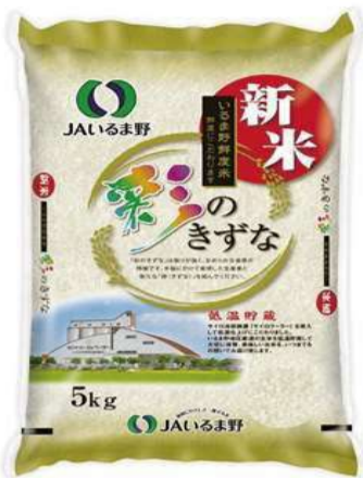
①埼玉県産 彩のきずな 令和6年産新米 5kg