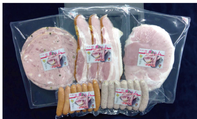
④日進ハム 5点セット