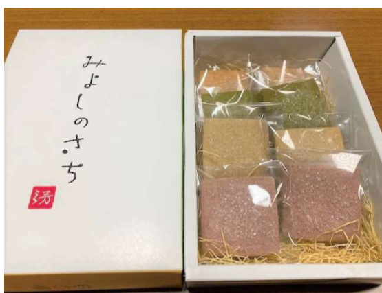
⑤みよしのさち クッキー 2箱セット