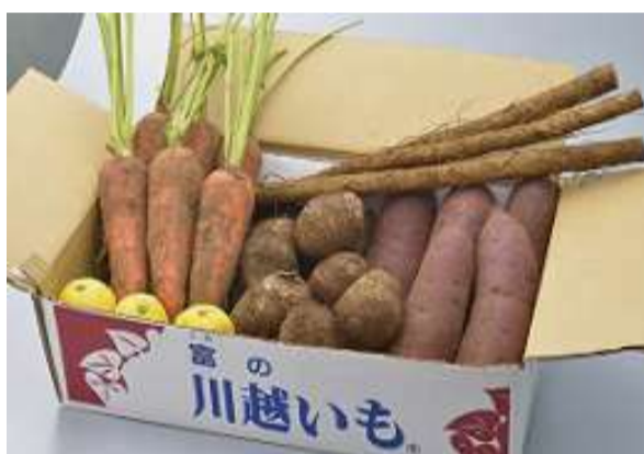
⑧三富落ち葉野菜セット