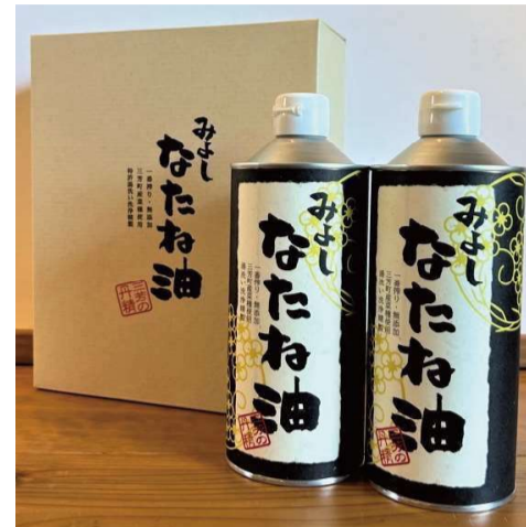
③三芳産 なたね油 2本セット