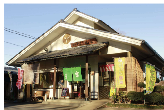
⑥手打そばうどん富 (住所：三芳町上富 155)