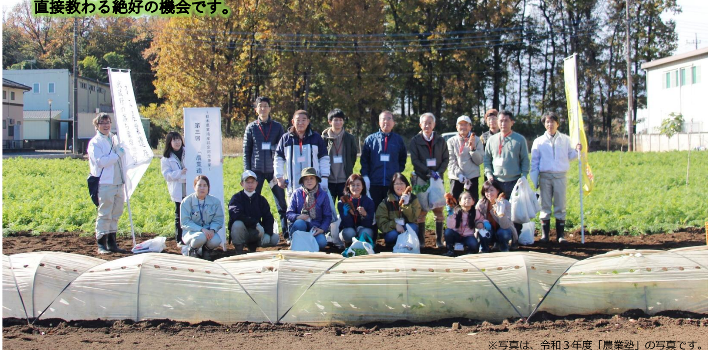
※写真は、令和3年度「農業塾」の写真です。

東京から30kmという大都市近郊に位置する三芳町で都市近郊農業を体験してみませんか？ 野菜の種まき・肥培管理・収穫など一連の農作業におけるノウハウを地域の指導農業士から 直接教わる絶好の機会です。