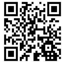
三芳町 HP 二次元コード

三芳町役場 総務課 職員担当 住所：〒354-8555 埼玉県入間郡三芳町大字藤久保 1100-1 電話番号：049-258-0019（内線 407・408） 三芳町ホームページ： https://www.town.saitama-miyoshi.lg.jp